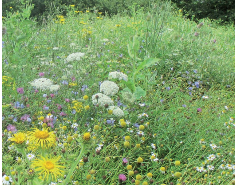
Wildpflanzen werden für die Herstellung von Biogas genutzt