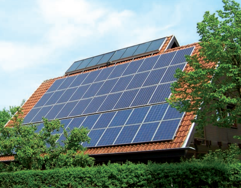
Energielieferant: Ein Haus mit Photovoltaik und Solarthermie