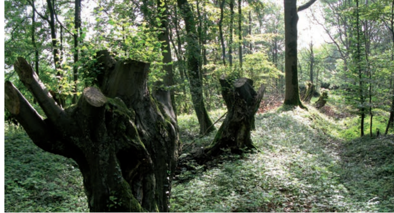
Waldgebiet im Kreis Warendorf